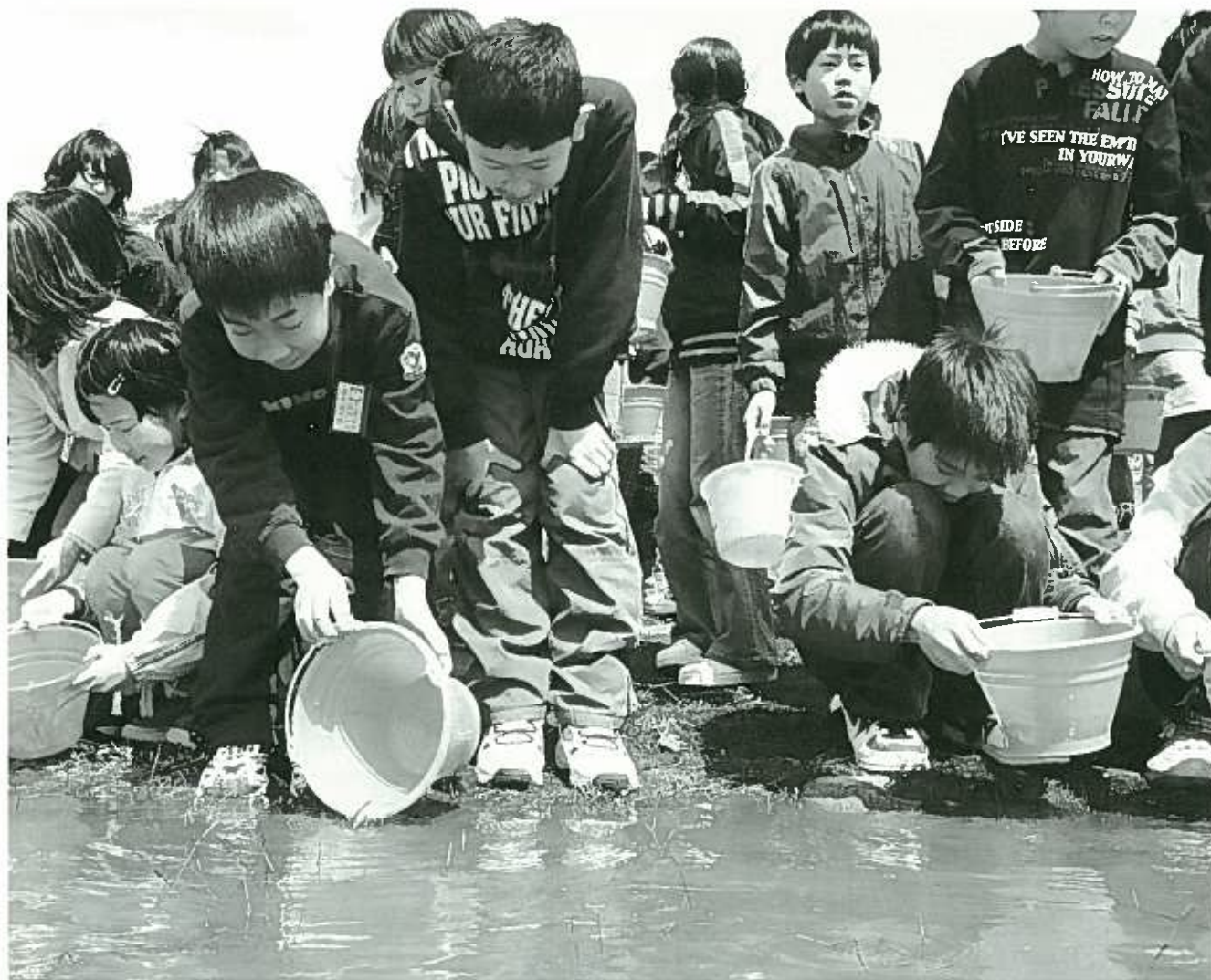
「鮭稚魚放流式」 村上市