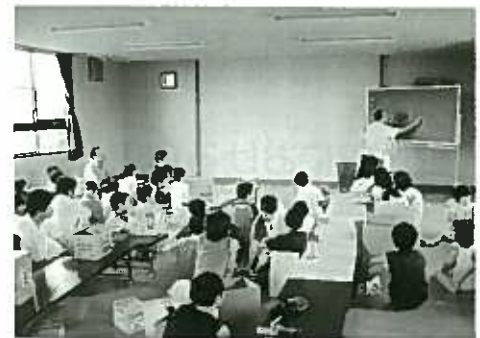
ピンホールカメラ作成

公民館分館には、協力員と呼ばれる方が1名勤務しています。協力員は公民館事業を行う際、地域のニーズ・講師等の情報収集を行う等、分館活動を支えています。また、各分館に町内会・小学校・老人クラブ等の代表者5名を分館推進員として据え、協力員と共に内容検討を行い、地域住民講師の力も合わせ、地域発信で分館事業が行われています。