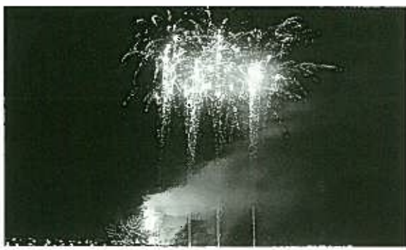
5000個の明かりに復興祈願

周りの山々も少しずつ雪が消え、里では鳥達のさえずりと子ども達の陽気な笑い声が聞こえる季節となりました。私どもの旧上川地区は、平成十七年四月一日から旧津川