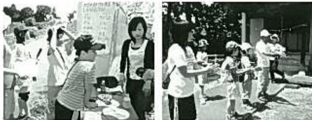
■ウォークラリーの様子

※公民館側は事前の準備を手伝い、ウォークラリー中は全体把握と安全を確保するために各チェックポイントを見回る程度でした。