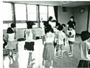
■第1回目の様子 〔「ゲームであそぼう」〕