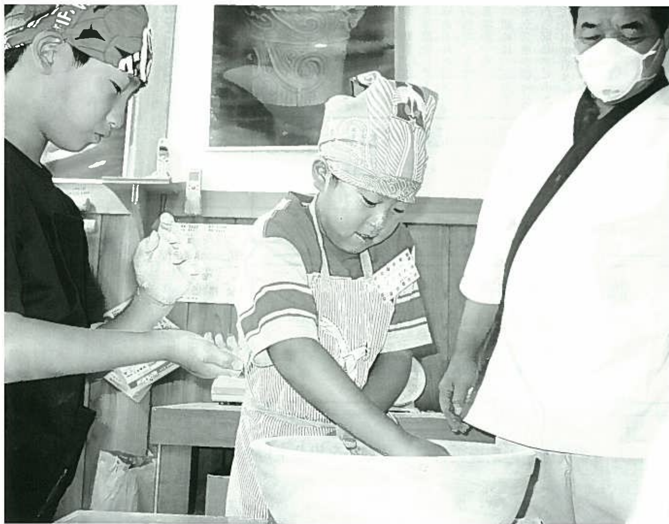
「キッズ倶楽部 そば打ち体験」西川町