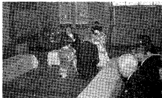
写真は長岡市上川西公民館の公営結婚から……夫婦ちぎりの盃式