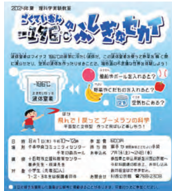
教室開催のお知らせ・募集

普段の生活では触れる機会のない液体窒素を使った実験です。液体窒素を入れたピーカーに、花、風船などを入れて変化を観察します。花びらはぱりぱりに