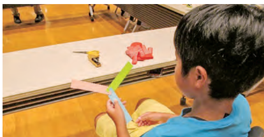
プーメランの作製

縦に投げることで翼と風が方向を変える力を作り出すことを、作製から体験し学びます。戻らずに遠くへ行ってしまうプーメランもあり、先生に尋ねると、「羽の微妙な曲げ」がポイントと教えてくれました。上手く飛ばせなかった子どもも、自分のところに戻りキャッチ出来るようになりました。