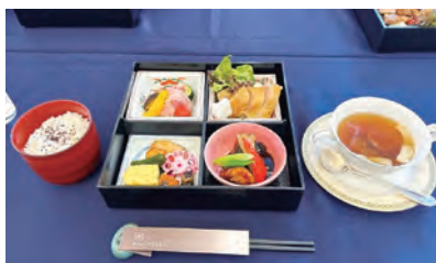
お弁当で昼食会、和気藹々と

令和6年6月14日(金)に上越市で関東甲信越静(関フロ)公民館連絡協議会第1回理事会を開催しました。会場のデュオ・セレソンは11月7日(木)の第64回関フロ公民館研究大会の情報交換会を予定しており、各都県の皆さんに会場を見てもらう目的もありました。理事会には各都県の県公連等の会長、理事長の皆さん13名と上越市から3名、新潟県公連の事務職1名の17名の参加でした。