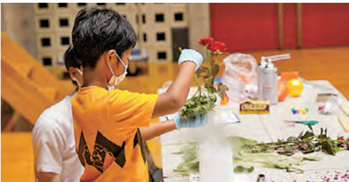
液体窒素に花などを入れ観察

普段の生活では触れる機会のない液体窒素を使った実験です。液体窒素を入れたピーカーに、花、風船などを入れて変化を観察します。花びらはぱりぱりに