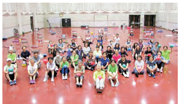
お仲間が全員集合