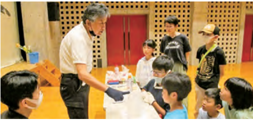
液体窒素の取り扱い説明