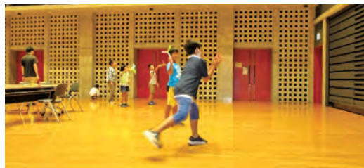
飛ばしてキャッチ！