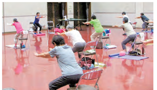
先生の指導で真剣なスクワット

をいただき真剣に取り組んでい ます。「アラー」「ウーン」と声 を出し「出来た」と喜びの笑 顔が弾けます。中でも尿漏れ防 止の骨盤底筋引き締め運動は効 果がみられ喜びの声が聞こえま す。 当初は二十名位でしたが、会 員数七十二名・平均年齢七十四 歳、男性会員の参加もあり短く 感じられる一時間です。 体を動かし、おしゃべりに花 が咲き心身ともに充実した時間 です。島内の皆さん是非参加し ませんか。(天池テル代記)