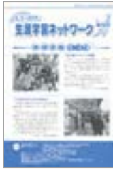
にいがた生涯学習ネットワーク

＜ラ・ラ・ネット公民館OPEN＞ 県立生涯学習センターが進めていた県内公民館の情報発信・共有サイトの＜ラ・ラ・ネット＞