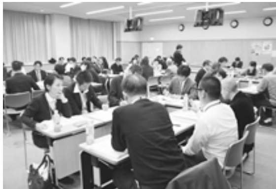
全国から約80名参加のセミナー