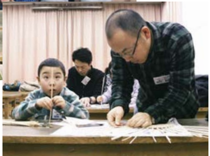
『エンジョイ★サンデー』（新発田市） 日曜日の午前中、親子で楽しくものづくりをしました。