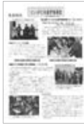
にいがた生涯学習通信