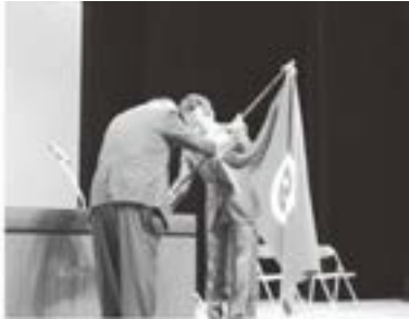
前開催地・聖籠町から妙高市へ大会旗を引き継ぎ(聖籠大会閉会式にて)

次期開催地の妙高市では大会開催に向けて準備を進めています。2月2日(火)に第1回開催準備会が同市で開催され、大会テーマ、講演講師、実践発表、アトラクション、参加料等の検討がされます。