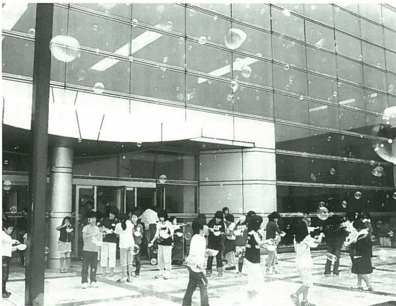
聖籠町 「地域子ども教室」