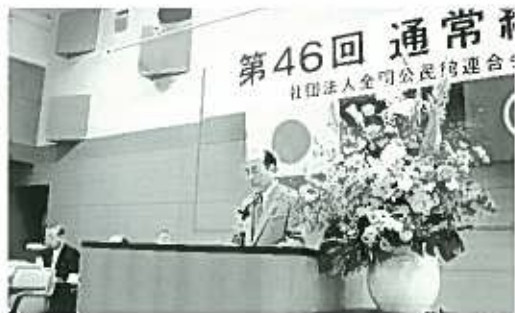
松下会長あいさつ