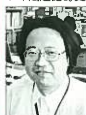
長岡市中央公民館活動係

そこで、今回は、彼の一端を紹介いたします。彼は、以前から公民館事業に携わると同時に、約7年間越路町史編さんの仕事を手がけておりました。