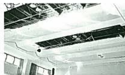
川口町公民館 天井ボード落下