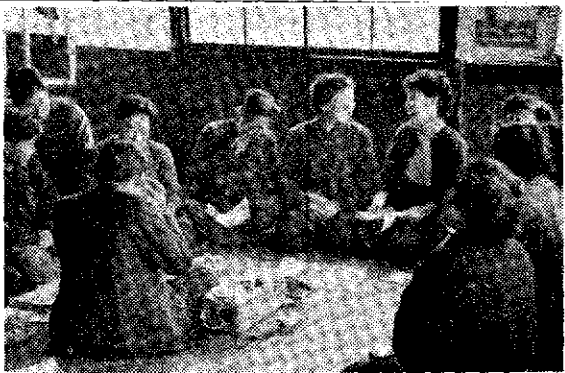
写真説明 鹿嶋間の録音テープ利用の青年学級 ● 部祭の夜学で十分 ● 時間にかううがない ● 等である。 ● 鹿嶋村で、広地域である割に、経営規模の小さな学区の特殊事情が大きく働いている結果と見うが ● 人手不足ということが、教

遊ばせ仲間の集りではないから希望にそつちな施設がなされていないから ● 希望があつて出られない者が平等が主なものである。 ● 不参加の理由として合理的であるかどうかが、遊び仲間の集りと視察する傾向が、学区に数少ない高校卒業生者よりむしろ中学卒の青少年に多いことも問題である。