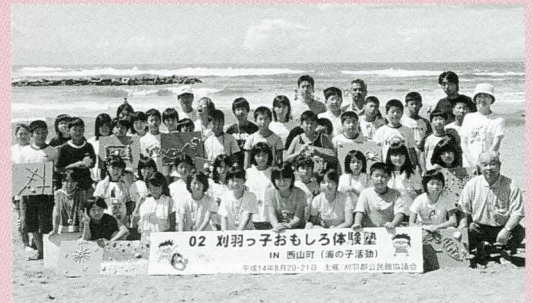
参加者全員でハイチーズ!