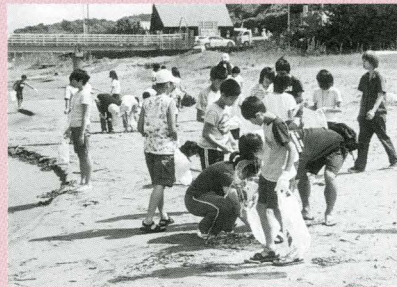
「海岸のクリーン作戦」 「たくさんのゴミがあるね」

クチャー、塩作り、貝工作、海釣り、クリーン作戦、海水浴等の体験から海と人間との関係、