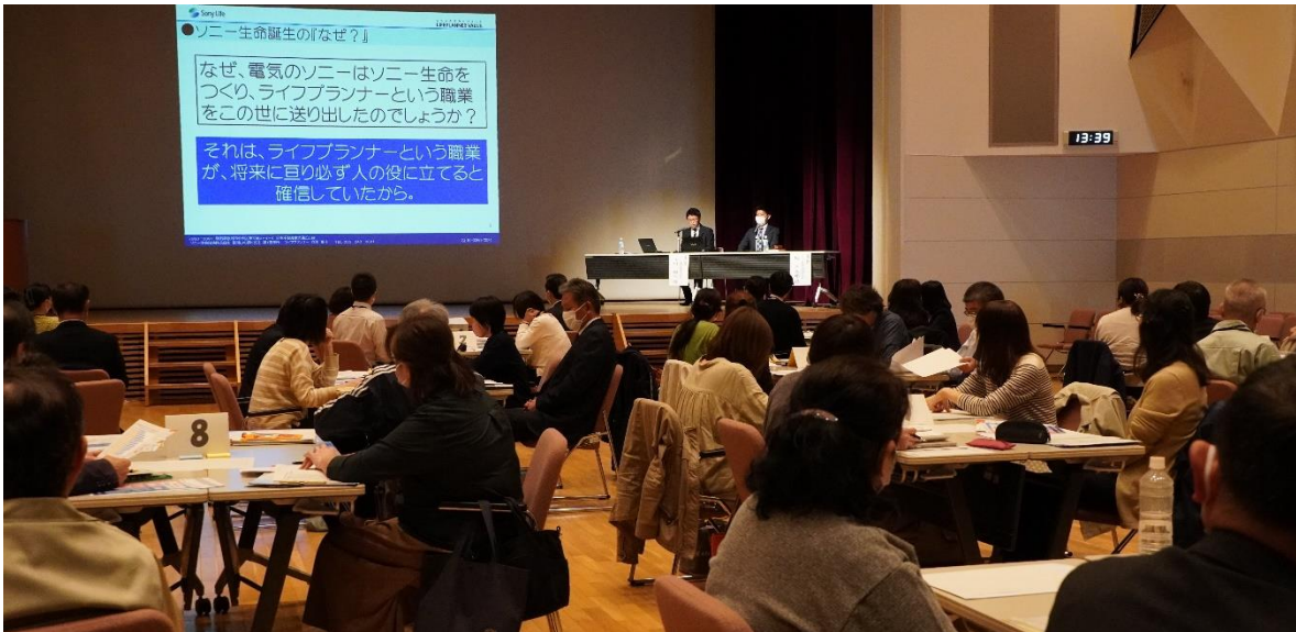
全市の公民館職員 120 名の約半数が集まり、熱心に研修