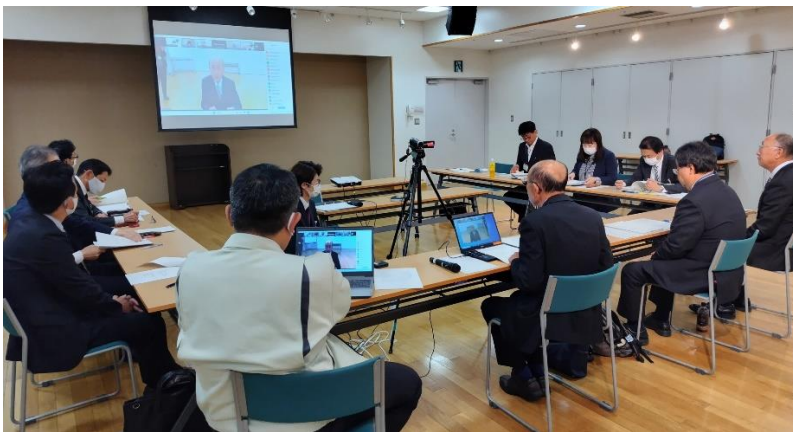
主会場の直江津学びの交流館に13名が集合

今まで上越地域3市、上越教育事務所社会教育課、県公民館連合会会長・事務局長で準備委員会を3回開き、準備を進めてきました。今回の実行委員会から県公連加盟全市町村の代表公民館長に参加してもらいました。その時の様子について、写真を交えて報告します。